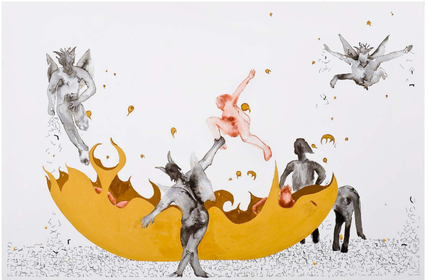
"La pez, canto XXI Infierno" Técnica mixta sobre papel 95,5 x 195,5 cm. en marco de aluminio mate.