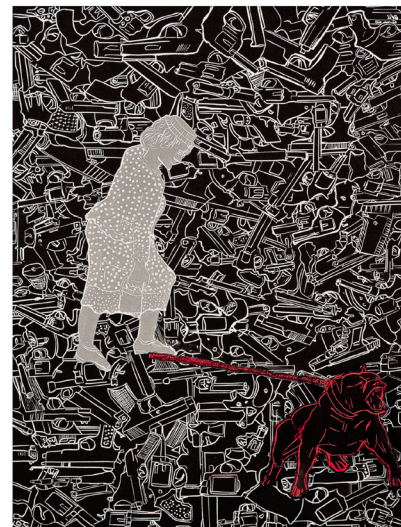
“...multiplicada en espejos...” Serie Emma Zunz. Collage a partir de figuras en linóleo impresas, sobre fondo de impreso, linóleo, sobre papel 41 x 30 cm. Texto “Pública”