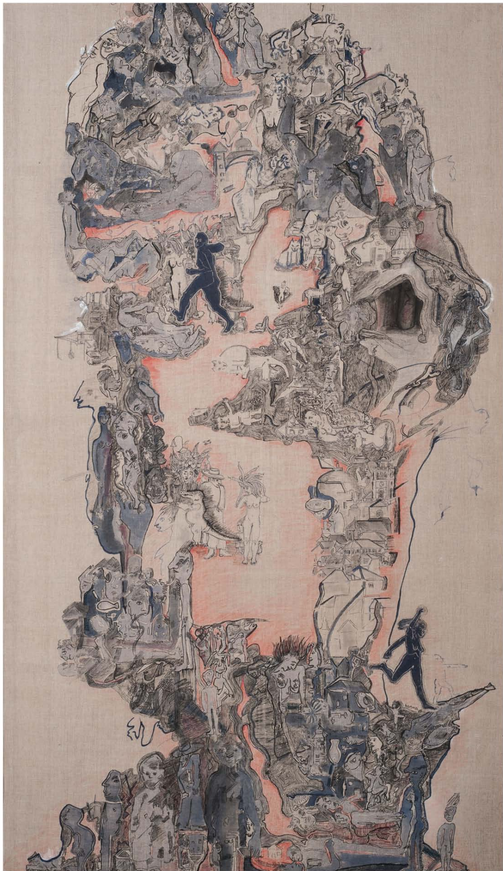
"Continuum I", Técnica mixta sobre lino. 197,5 x 111 cm. 2009