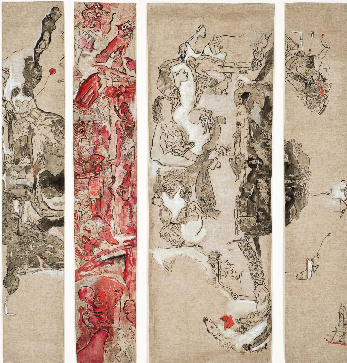
"Figura II" Técnica mixta sobre lino. 175 x 95 cm. 2013